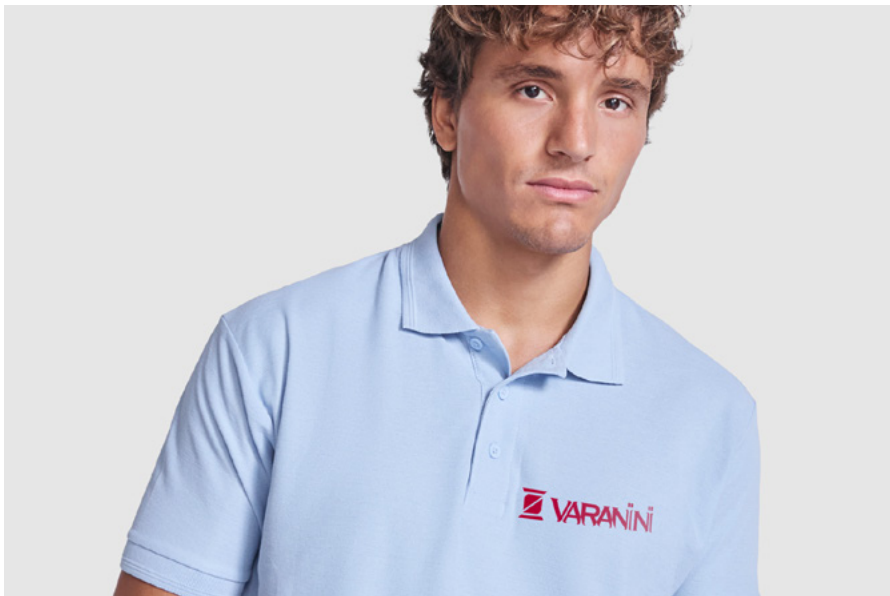
Produzione divise aziendali per L'azienda Varanini