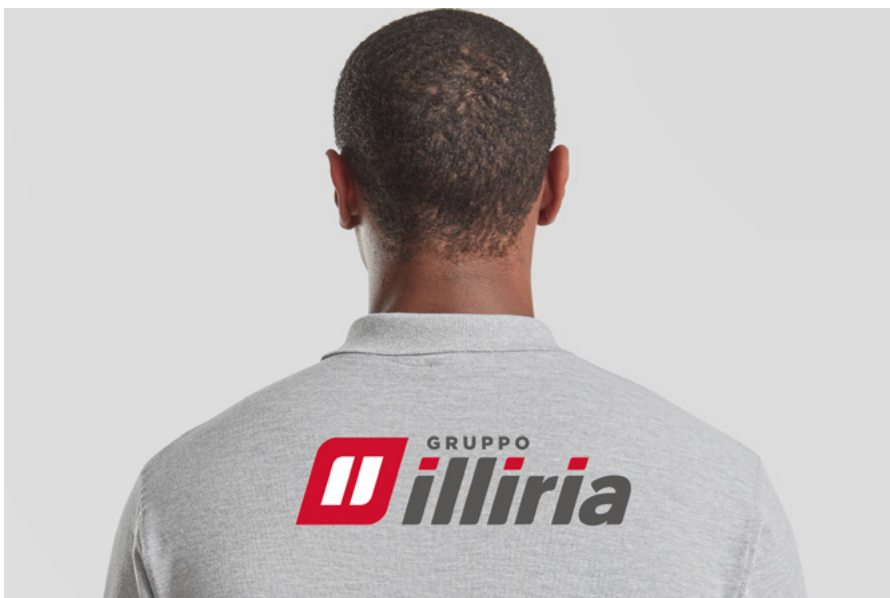
Produzione divise aziendali per L'azienda Illiria