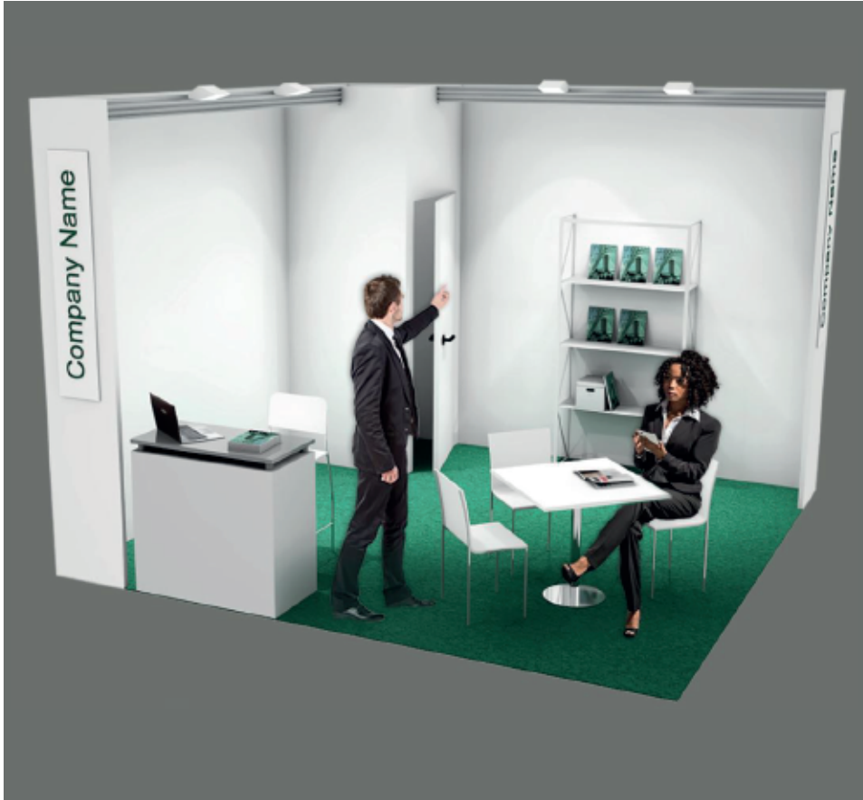
Soluzione 2 lati aperti / Two open sides booth