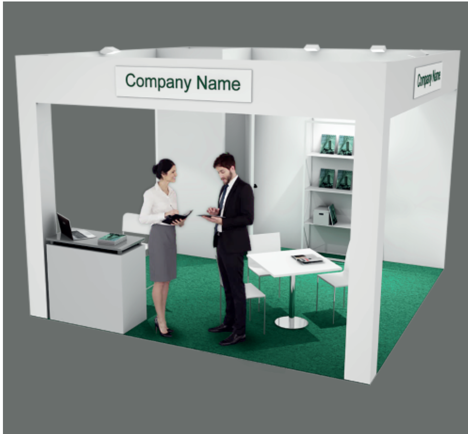
Soluzione 3 lati aperti / Three open sides booth