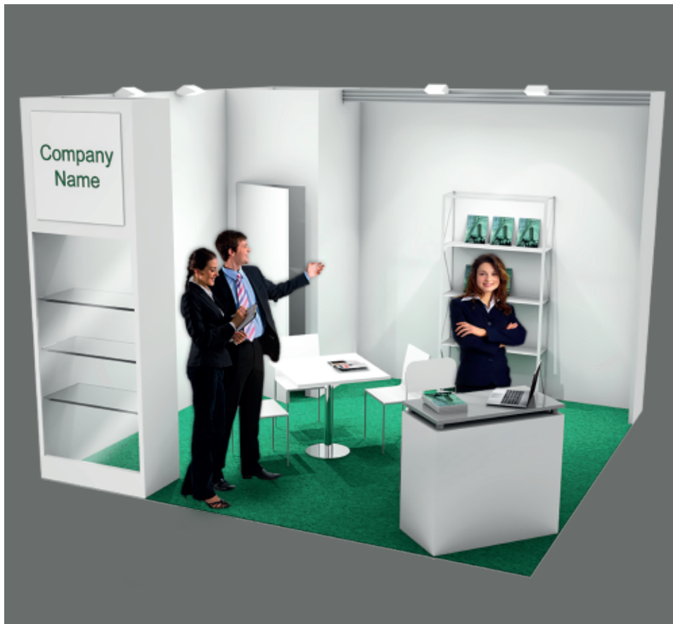
Soluzione 2 lati aperti / Two open sides booth